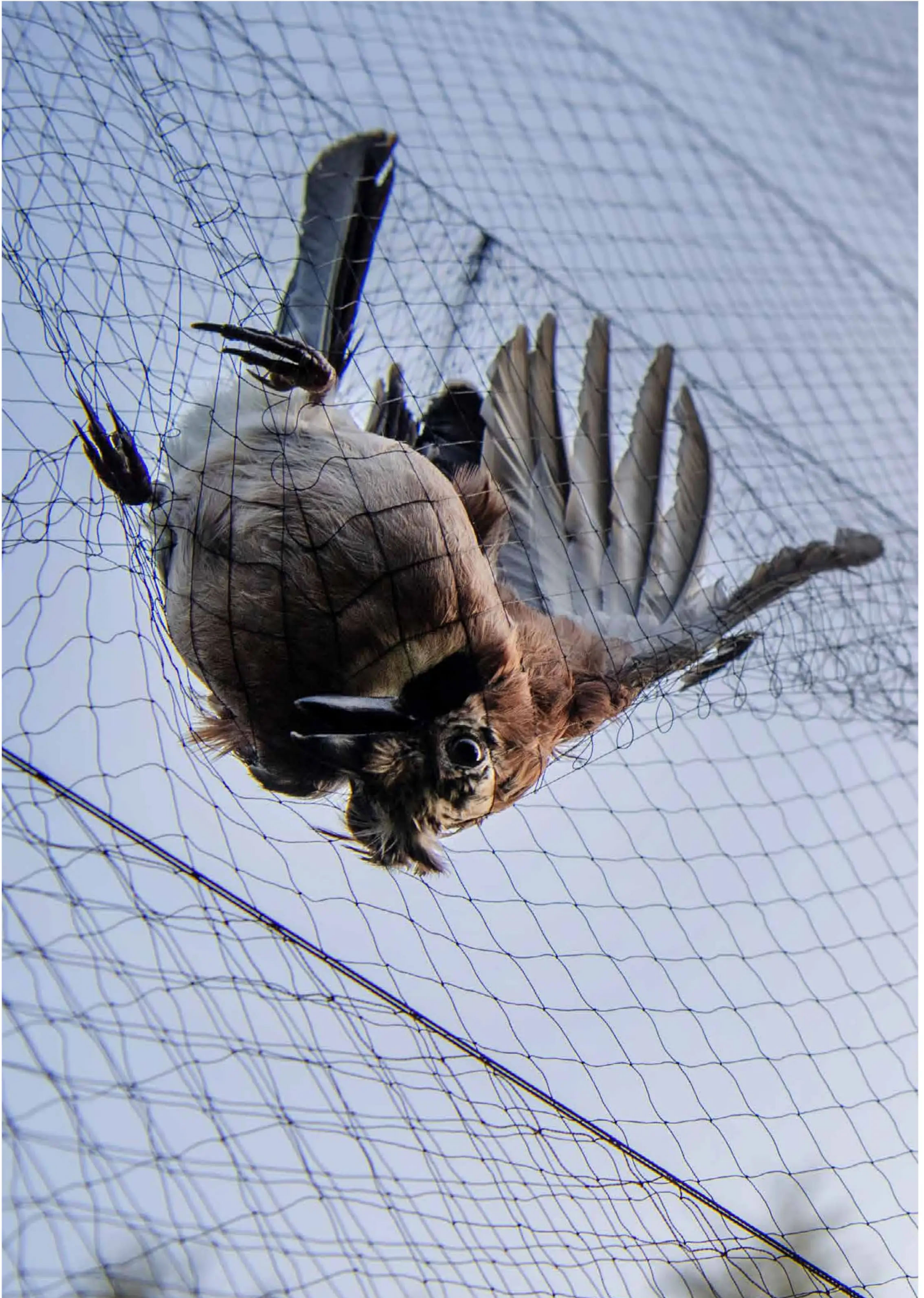
Ringmärkningen på platsen norr om Alvesta har pågått i tio år. Runt 10 000 fåglar har märkts.