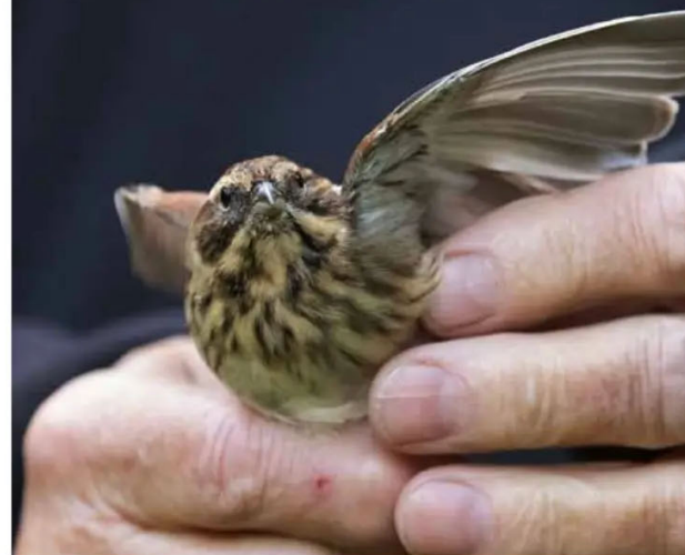
En sävsparvhona som snart ska släppas fri efter ringmärkningen.