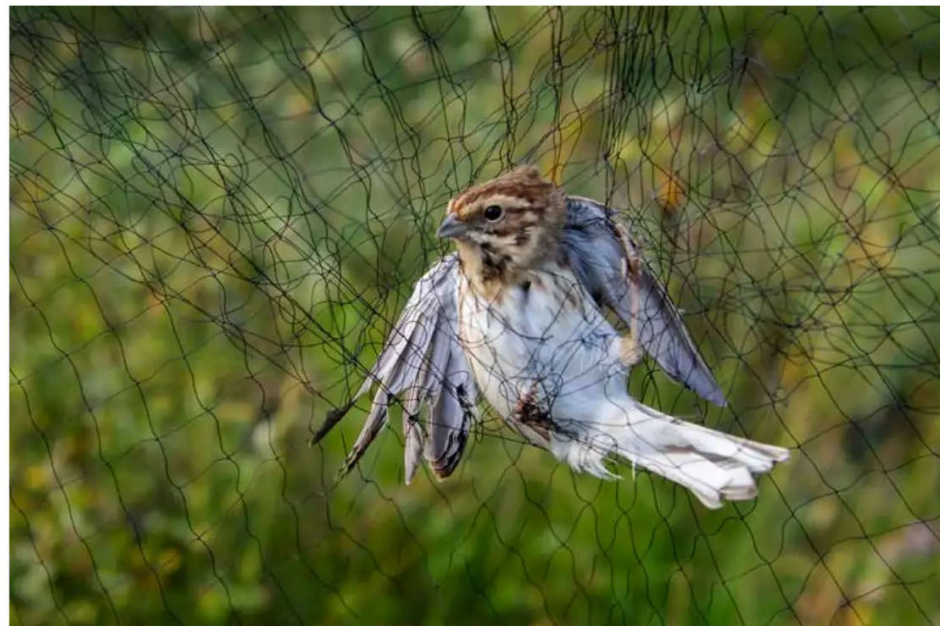
En sävsparv har hamnat i nätet. Snart ska den märkas med en aluminiumring.