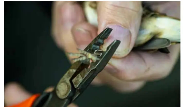
Varje fågel vägs, mäts och får en aluminiumring på ena tarsen.