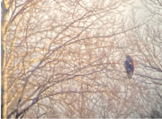
Minna på besök vid Dällingen, nordost om Växjö, 25 april 2022.

kondition med en fantastiskt fin fjäderdräkt. Vingarna var i fint skick och satellitsändaren var fast placerad på ryggen, vilket kunde konstateras när örnen lyfte strax efter kl 7 och drog mot NO.