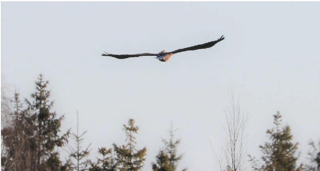
På denna bild från Björkefalla, Vittsjö den 22 april kan man se GPS-enheten skymta på Minnas rygg.