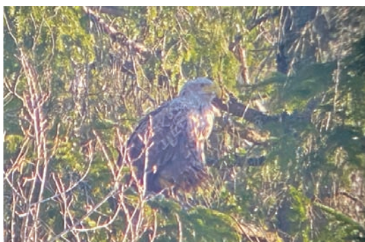
Minna på nattkvist vid Björkefalla, Vittsjö, nära den småländska gränsen 22 april 2022.